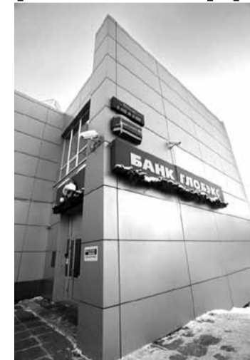
единовременная — по окончании срока депозита.

Депозит с возможностью пополнения по суммам первоначального взноса, срокам и порядку начисления процентов аналогичен отзывному депозиту. Только выплата процентов