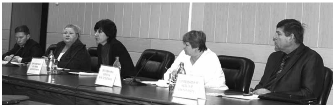
Опасные производства Кемеровской области должны будут начать свою работу в 2012 году с полисом страхования гражданской ответственности владельца предприятия за причинение вреда в результате аварии.

Напомним, что федеральный закон №225 «Об обязательном страховании гражданской ответственности владельца опасного объекта за причинение вреда в результате аварии на опасном объекте» был принят в первом чтении ещё в 2005 году.