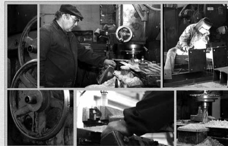
«Бутовская», поступившего в 2011 году, стало очередным этапом по решению нестандартных задач. На первый взгляд, всё мало чем отличалось от обычных типовых заданий — шла поставка оборудования для строящегося на шахте вентилятора главного проветривания. Сложность заключалась в том, что в комплект поставки оборудования, над которым работали специалисты КЭЗСБ, входили металлоконструкции воздушных и запорных устройств суммарным весом более 35 тонн. При этом завод взял на себя обязательства не только на изготовление нестандартного оборудования — в крайние ограниченные по времени сроки, но и на перевозку готовых изделий, включая негабаритные грузы. Заказчики давно знают, что сложное по технологическому решению задание всегда сумеют выполнить именно на КЭЗСБ — здесь умеют и нестандартно мыслить, и преисполненно воплощать свои замыслы в реальное дело.

алью новых разработок, но и путём усовершенствования проверенных временем моделей оборудования. Начиная с июня, здесь заняты массовым производством модернизированных установок автоматического пожаротушения ленточных конвейеров. Новая линейка установок пожаротушения отличается от производимых ранее рядом заметных преимуществ. Значительно сокращены сроки и трудоёмкость их монтажа, упрощён про-